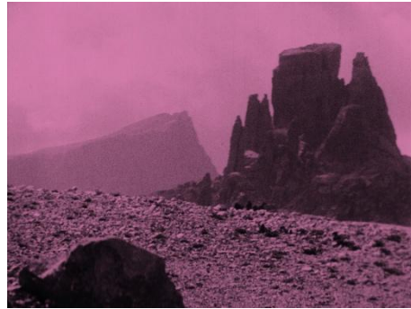
Abb. 6 und 7: Der Berg des Schicksals, 00:20:57 und 00:16:43

Filmstills erstellt von der Mumau-Stiftung © Friedrich-Wilhelm-Mumau-Stiftung