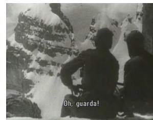
Abb. 3–5: Berge in Flammen , 00:01:38, 00:11:32 und 00:15:25 Filmstills erstellt von der Autorin

Dramaturgisch ist der Film nicht durchgehend überzeugend. Immer wieder wird zwischen weiteren und engeren Bildausschnitten geschnitten, ein Mittel, das zur Spannungssteigerung dienen kann, aber bei einem ungelungenen Einsatz ebenso ermüdende Züge bekommt, wodurch der Film an manchen Stellen eher langatmig wird. Dazwischen zeigt sich aber auch immer wieder Trenkers große Stärke – die eindrucksvollen Bergaufnahmen. Sie markieren Schlüsselstellen des Films: z.B. wenn die Männer des Dorfes als Soldaten in den Krieg ziehen und ein breites Bergpanorama mit Weg zu sehen ist (Abb. 4, 00:11:32); wenn Dimai und ein Kamerad auf ihrem Wachposten auf einem Felsvorsprung als Rückenfiguren sitzen und über ihre Abwesenheit von zuhause sprechen (Abb. 5, 00:15:24), wenn Franchini durch das Fernrohr den Berg beobachtet und dabei Dimai entdeckt (00:52:15) oder wenn am Schluss Dimai und Franchini erneut gemeinsam den von den kriegerischen Auseinandersetzungen gezeichneten Berg besteigen (01:32:23).