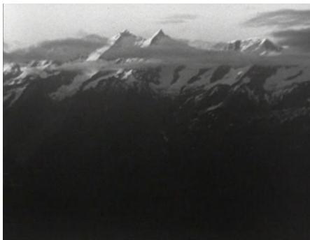
Abb. 15: Der Berg ruft , 00:57:27 Filmstill erstellt von der Autorin

Ein wenig anders gelagert ist es mit dem Heimatfilm. Hier ist der Sammelbegriff ähnlich diffus wie beim Bergfilm, basiert er in diesem Fall doch maßgeblich auf Aspekten der Zugehörigkeit und der lokalen Zuschreibung. Ich kehre hier zu meinem anfänglichen Impuls und meiner These zurück: Der Berg ruft bedient mit seiner Bildwelt sowohl den klassischen Bergfilm der 1920er Jahre als auch den sich erst langsam ausbildenden Bilderkanon des Heimatfilms. Zu letzterem zählen beispielsweise die Handlungsorte – der ländliche Gasthof in Breuil vs. das mondäne Hotel in Zermatt – oder auch die Kleidungsstile – Trachtenkleidung vs. Anzug und natürlich die entsprechende Sportkleidung. Derartige Polaritäten sind für das Genre des Heimatfilms typisch, da mit ihrer Hilfe die entsprechenden Sehnsüchte, Verluste, Ängste etc. kurzum, die jeweiligen Emotionen geweckt werden.