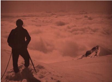
Abb. 11: Im Kampf mit dem Berge, 00:37:56 Filmstill erstellt von der Autorin © Friedrich-Wilhelm-Murnau-Stiftung

Den Höhepunkt des Films markiert nicht etwa der Augenblick auf dem Gipfel – dieser ist in der Hälfte des Films erreicht und eröffnet in einem langsamen Kame-raschwenk den Blick über die Berggipfel –, sondern es ist eine knapp 20-sekündige Einstellung wenig später (Abb. 11, 00:37:56–00:38:12), bevor der Abstieg über die Eiswand in den Abendstunden erfolgt. In diesem Tableau vivant steht aus der Mitte nach links gerückt, ganzfigurig, in Rückenansicht Schneider in aufrechter, mit Aus-fallschritt und leicht auf den Eispickel in seiner rechten Hand gestützter Haltung. Der Blick gleitet über das Wolkenmeer, aus dem nur vereinzelt Berggipfel ragen, dem Gefahr zugesprochen wird – dies wird mit Aufschlagen des Nachtlagers noch-mals explizit betont (00:54:49).