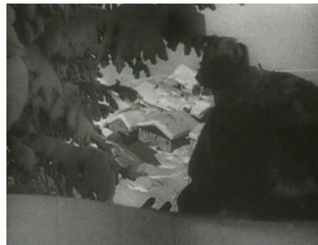
Abb. 16: Berge in Flammen , 01:14:43

Vereinzelt finden sich entsprechende Motive bereits in Berge in Flammen : Wenn Dimai auf sein Heimatdorf blickt (Abb. 16), folgt der Bildaufbau klassischen Prinzipien der Heimatkunst und zugleich wird die identitätsstiftende Landschaft emotional aufgeladen. Thematisch wird Heimat verhandelt und bildlich rückt die unberührte, schneebedeckte Landschaft, mit dem im Tal liegenden Dorf in malerischer Form in den Fokus. In diesem Augenblick sind die Bergdarstellungen Sehnsuchtsbilder, die Heimat- und Verbundenheitseemotionen evozieren und damit einen Konterpart zu den Kriegsbildern darstellen.