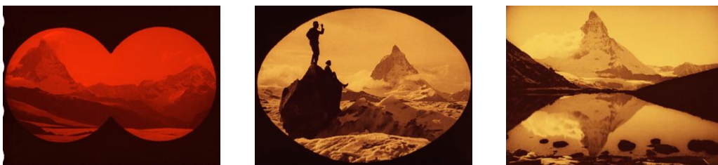
Abb. 8–10: Im Kampf mit dem Berge , 00:10:55, 01:06:15 und 01:06:34 Filmstill's erstellt von der Autorin © Friedrich-Wilhelm-Mumau-Stiftung