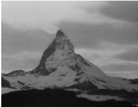
Abb. 1: Der Berg ruft, 00:02:15 Filmstill

Der schwarz-weiße Tonfilm wurde am 6. Januar 1938 im Berliner UFA-Palast am Zoo uraufgeführt. 3 In 95 Minuten wird die Freundschaft der beiden Protagonisten mit der Erstbesteigung des Matterhorns enggeführt und beides mit tragischen Wendungen erzählt. 4 Dem Berg werden als Orte das Gasthaus in Breuil im italienischen Aostatal (Carrels Ausgangspunkt) und das Hotel im schweizerischen Zermatt (Whympers Ausgangspunkt) zur Seite gestellt. Der Film beginnt mit einem Kamerashwenk über den Wolkenteppich (00:02:00–00:02:13), um dann in einer Überblendung zu einer statischen Aufnahme des Matterhorns zu leiten (Abb. 1, 00:02:14–00:02:29), gefolgt von Bildern des Alltags (Heumachen, ab 00:02:38) und den Gefahren des Bergs (durch tödlichen Steinschlag, 00:03:39). Der anschließende Blick von Breuil aus durch das Fernrohr ist der Auftakt für die ersten Kletterpartien (00:04:51). Hiermit sind also in den ersten fünf Minuten nicht nur ein Großteil der Protagonist*innen, sondern auch der Schauplätze und der Darstellungskonventionen des Films vorgestellt.