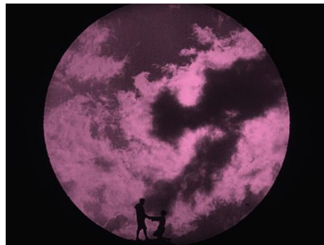
Abb. 13 und 14: Der Berg des Schicksals , 00:32:51 und 01:42:08