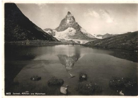
Abb. 2: Historische Postkarte, Zermatt, Riffelsee und Matterhorn, Nr. 6473, Editions Schwegg Fils & Co. Lausanne, ca. 1920er (?)

Aufnahmen des Matterhorns werden immer wieder prominent ins Bild gerückt. Dabei wird der Berg oftmals als Solitär aus einer leichten Untersicht inszeniert, der so hoch erscheint, dass er in die am Himmel ziehenden Wolken reicht. 1938, zur Entstehung des Films, ist dieser Blick ein bereits gut etabliertes Motiv: Auf diversen fotografischen oder gezeichneten Postkarten (Abb. 2) ebenso wie auf Plakaten wird bereits im 19. Jahrhundert mit der Aussicht auf den unerreichbar scheinenden Gipfel geworben, der ikonisch für den Berg als Solitär steht. Die Erstbesteigung 1865 löste einen regelrechten Hype um den Berg aus: Die Spekulationen, Verleum-